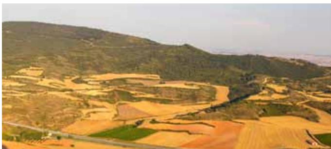
ZH6 Zona agrícola tradicional occidental ■ Mendebaldeko usadiozko nekazaritza gunea