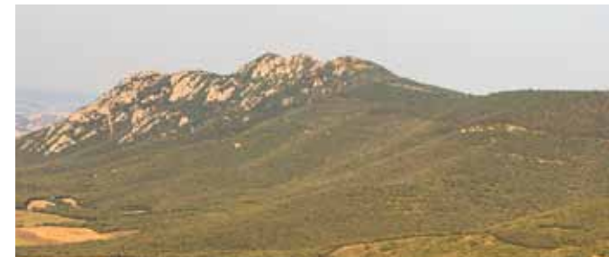
ZH3 Ladera forestal de Montejurra ■ Jurramendiko hegaleko basoa