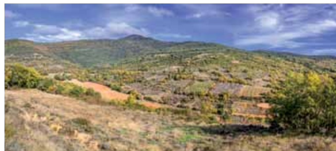
ZH5 Zona de mosaico monte-cultivo de la Solana ■ La Solanako mendi-labore mosaikoko gunea