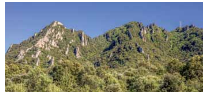
ZH4 Entorno de la cumbre ■ Gailurraren ingurua