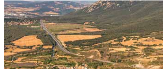
ZH2 Ladera noroeste de Montejurra (Deio) ■ Jurramendiko ipar-mendebaldeko mendi hegala (Deio)