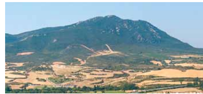
ZH1 Zona antropizada de Estella-Lizarra y Ayegui / Aiegi ■ Lizarra eta Aiegiko gunee antropizatua